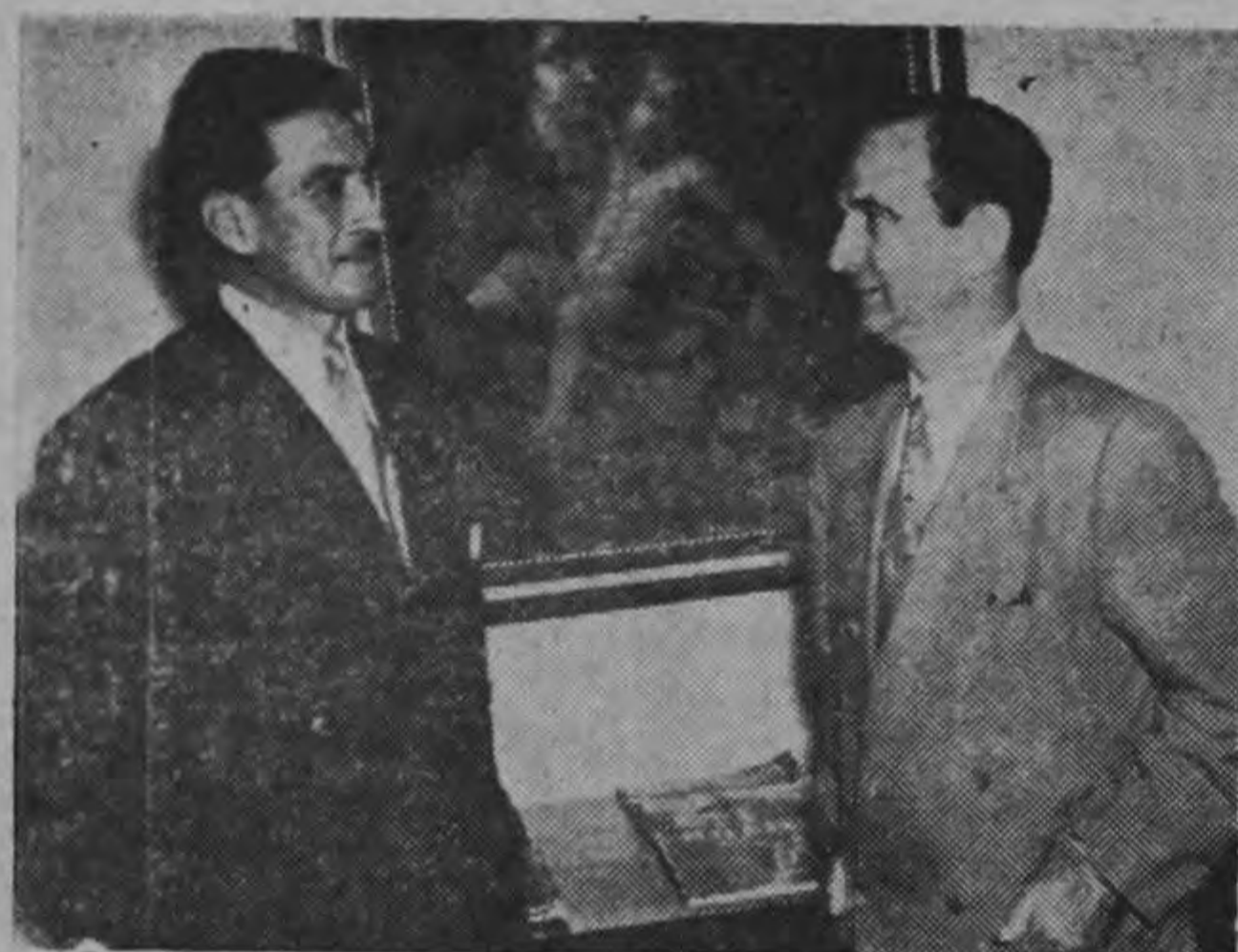
Con el Encargado de Negocios de Guatemala.