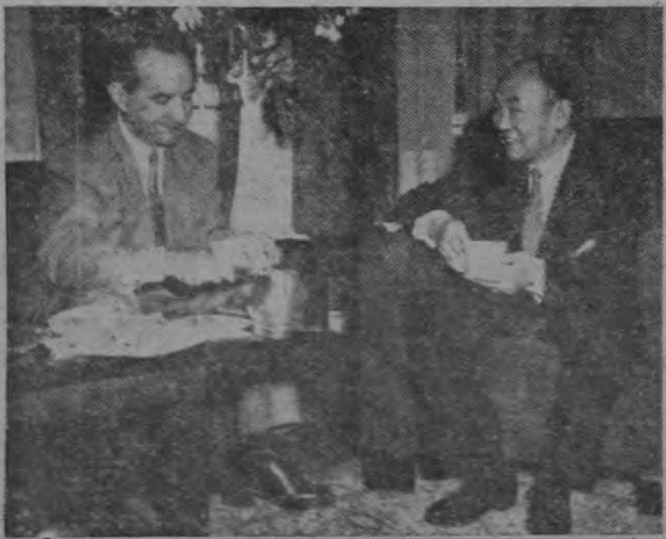
Con el Ministro de China.