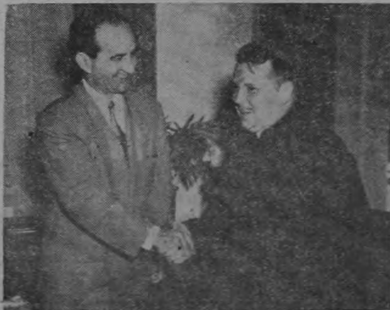
Con el Nuncio Apostólico de Su Santidad, Decano del Cuerpo Diplomático, Monseñor Paul Bernier.—(Foto TRISTAN).

Según la gran cantidad de partes presentadas durante el mes de julio y primeros días de agosto, la delincuencia infantil está aumentando. Las denuncias por hechos delictuosos cometidos por menores siguen llegando en forma alarmante teniéndose casi por seguro que este mes batirá un récord de delincuencia entre niños.