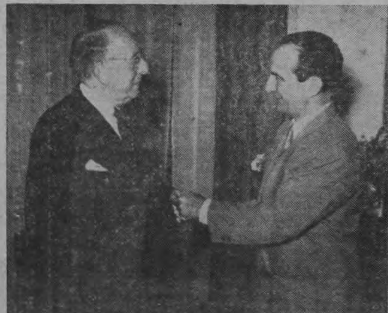
Con el Ministro de Italia.